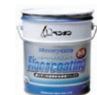
食品関連、流通、学校等で