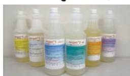
各1L 定価3,000円 原液～20倍で使用