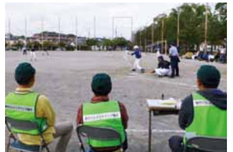
▲中央公園グラウンド