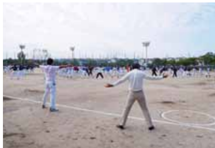
▲秋晴れの空の下全員でラジオ体操