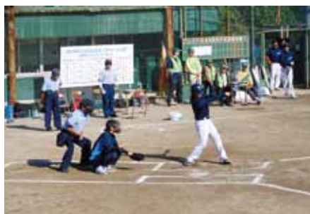
▲決勝戦(FFFファイターズVSサンエイ)