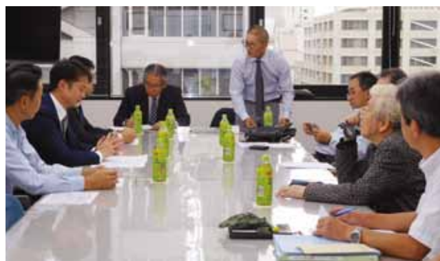
▲ビルメンこども絵画コンクール審査委員会