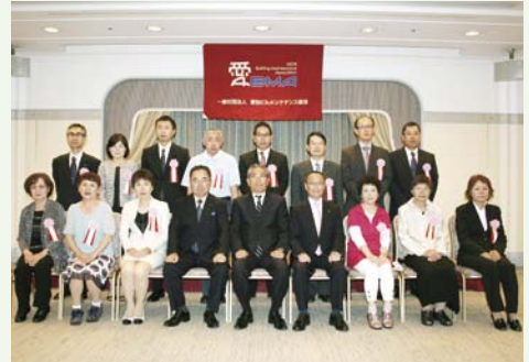
▲平成28年度 愛知県知事表彰の受賞の皆様