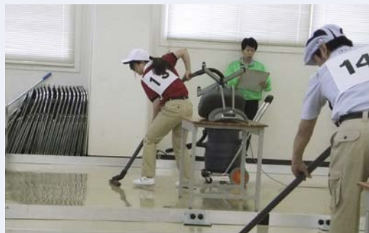
▲第14回(平成27年度)愛知地区予選会の様子