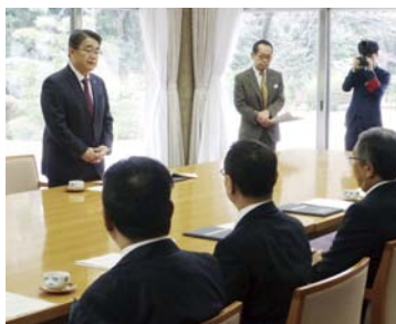
▲大村秀章知事 あいさつ

(協定書及び2月6日会員様への説明会については、びるめんニュース3月号 Vol.335に掲載)