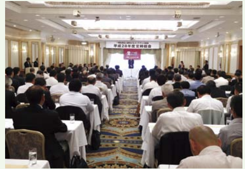
▲平成28年度 定時総会の様子

※平成29年度定時総会の開催については、協会ホームページから確認及び「出欠届」のダウンロード可能。