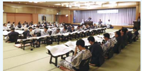
▲平成28年度 研修旅行の様子(伊勢志摩方面)