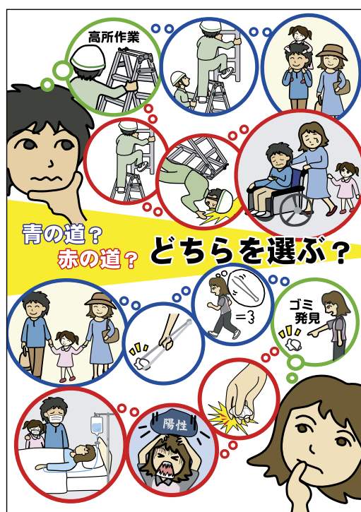
ポスター・デザインの部 最優秀賞 大日向マリコさん(コニックス株式会社)