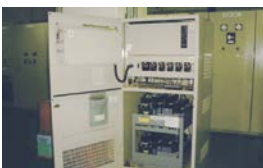
直流電源装置点検、蓄電池取替