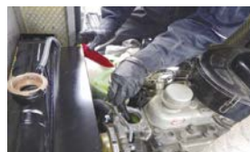
自家発電設備整備

非常電源・消防設備の保守管理会社 蓄電池設備・発電機設備・消防設備の販売・工事・整備・メンテナンス