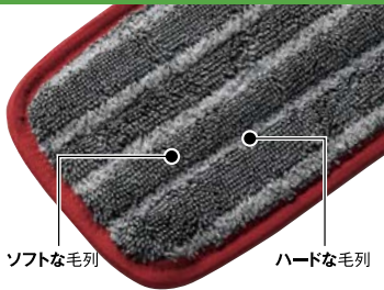
ソフトな毛列 ハードな毛列